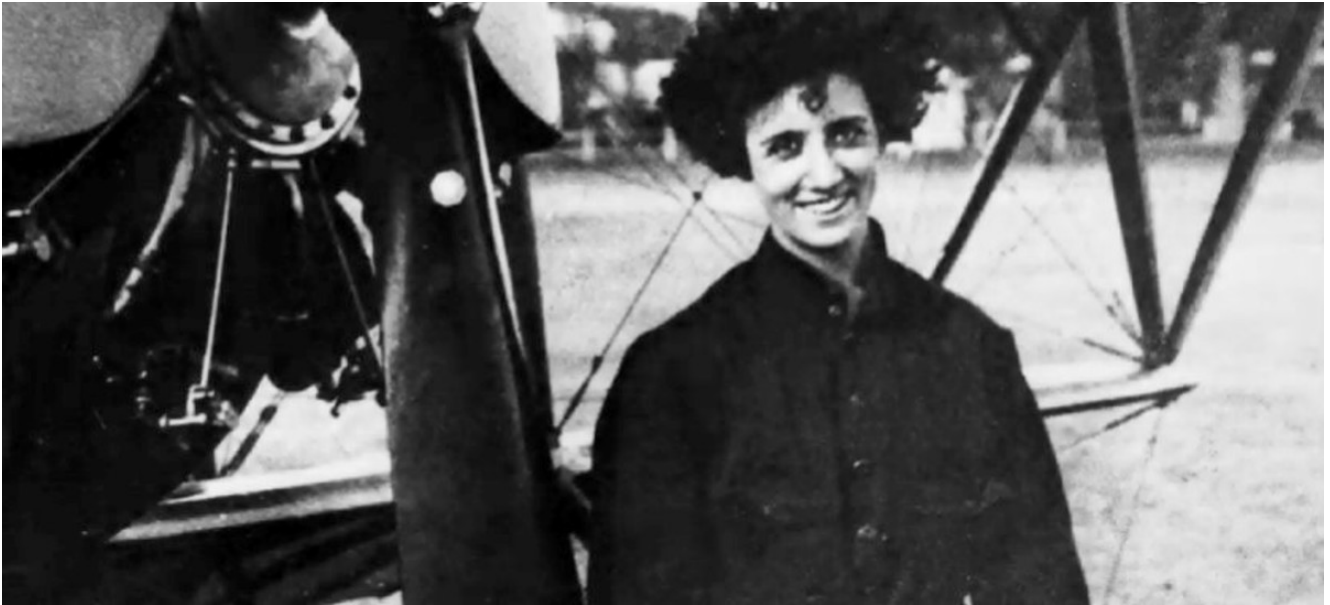
Adrienne Bolland.