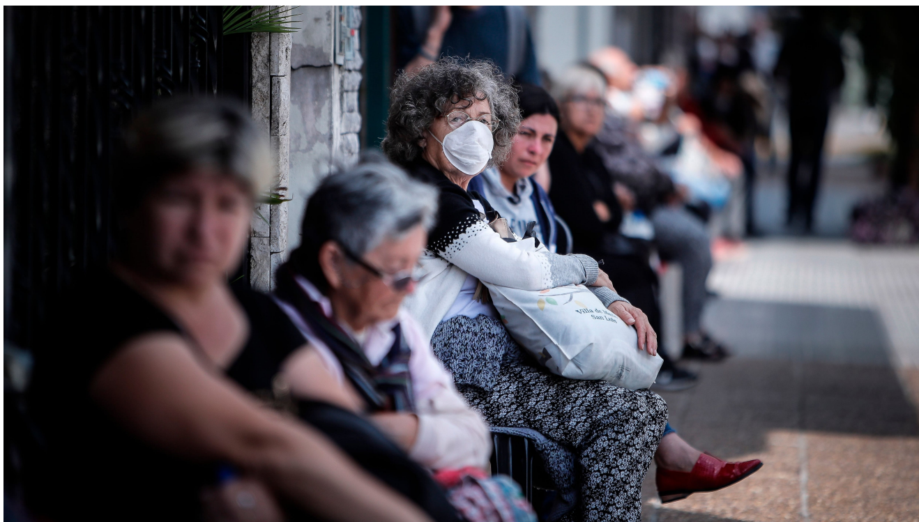
Personas que hacen fila afuera de un banco donde pagan

El artículo 1° de la ley señala que “los beneficiarios de jubilaciones y pensiones del Sistema Integrado Previsional Argentino (SIPA) y del Sistema de Pensiones no Contributivas quedan eximidos de la obligación de presentar la declaración de supervivencia o fe de vida , así como cualquier trámite complementario con igual fin, quedando sin efecto toda demostración de subsistencia a cargo del beneficiario como condición para el cobro de sus haberes y demás beneficios previsionales”.