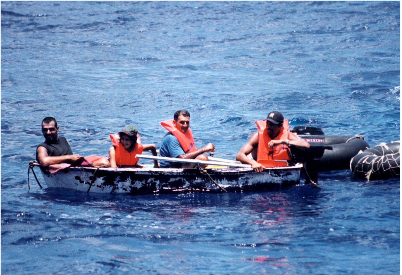
Foto de archivo de un grupo de inmigrantes cubanos llegando a las costas de Florida en un bote.

El hundimiento se produjo al norte de Bahía Honda (provincia de Artemisa), cuando la lancha transportaba a los balseros hacia Estados Unidos en medio de una ola migratoria que en apenas un año, después de la rebelión popular del 11 de julio, ha provocado el éxodo de al menos 220.000 cubanos .