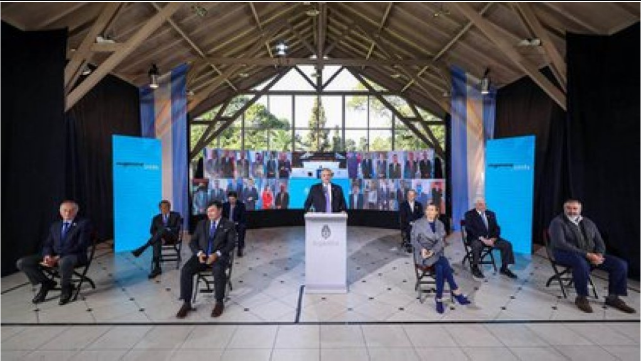
Alberto Fernández junto a empresarios y gremialistas en el acto del 9 de Julio del jueves pasado. Detrás de él, los gobernadores a través de conexiones virtuales