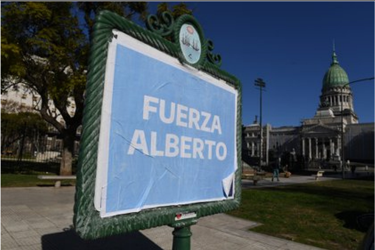
«Fuerza Alberto». Los mensajes que aparecieron en el Congreso

Hubo otro componente que explica en parte los enfrentamientos que existen en la cúpula del poder político. El domingo, mientras se viralizaba la nota compartida por Cristina Kirchner, el Frente Renovador inició la campaña “Unamos Fuerzas, cuidándonos”. El hashtag #UnamosFuerzas, en línea con el mensaje pronunciado por el Presidente el Día de la Independencia y promovido por ese espacio, logró incluso posicionarse entre las principales tendencias de Twitter del día. El líder de ese espacio y –probablemente– el mentor de esa jugada virtual es Sergio Massa, socio político de los Fernández en el Frente de Todos.