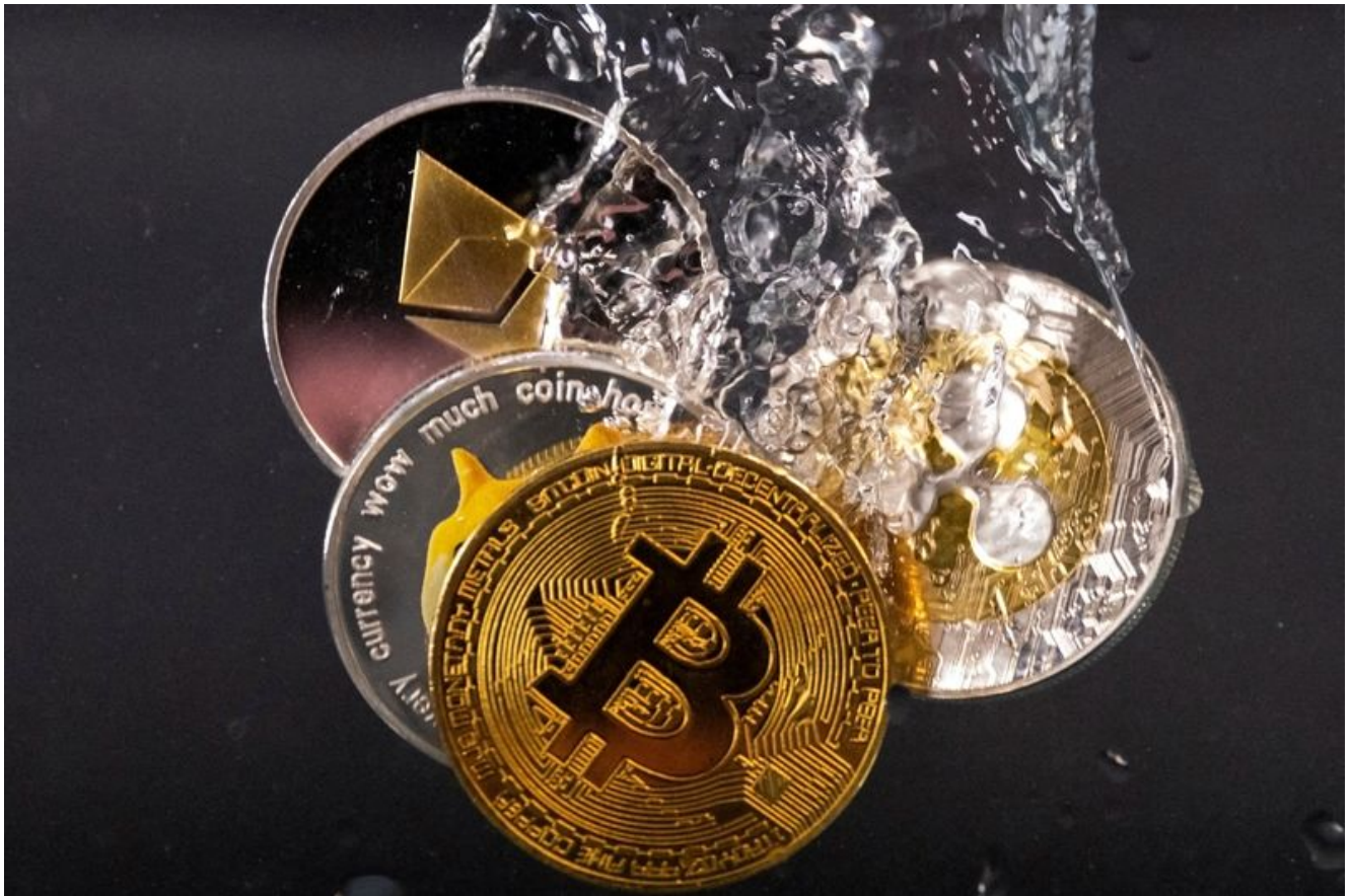
Imagen de archivo ilustrativa de tokens que representan a las criptodivisas bitc3in, 3ter, dogecoin y ripple sumergidas en agua tomada el 17 de mayo de 2022.