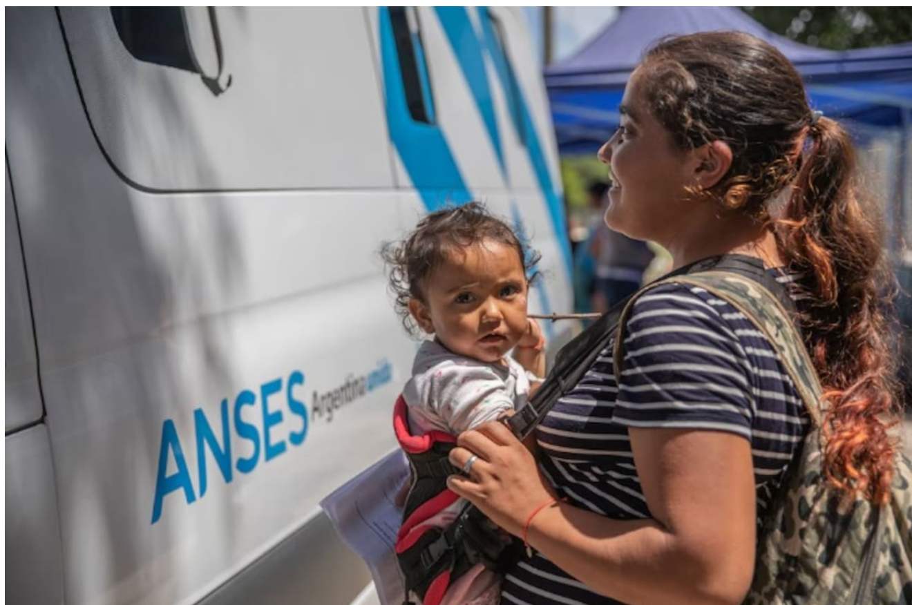
AUH, ANSES.

Por este motivo, desde el organismo recomiendan realizar el trámite incluso si se está cobrando el total mensual del beneficio.