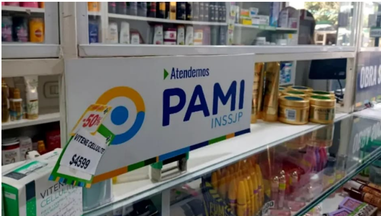
Medicamentos PAMI