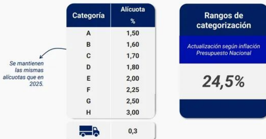
Tabla de cálculo del Impuesto Automotor 2026

El vehículo de referencia Gol Trend 1.6 modelo 2012 tiene una valuación de $9.239.310 . Por lo que el impuesto automotor debe ser del 1.6% y da $147.828.96. Una camioneta Amarok 2.0 TDI 4x2 tiene una alícuota de 2% y un valor de referencia de $43.021.935, por lo que el impuesto es de 860.438,7. Estos valores son anuales.