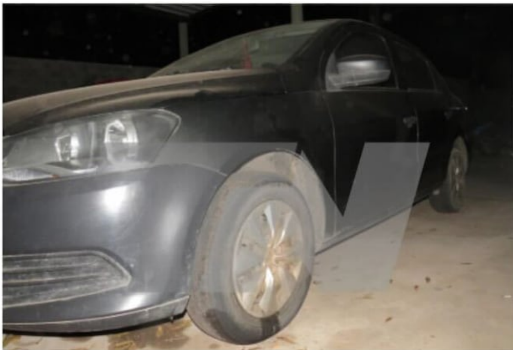
Fotografía General de los laterales del AUTOMOVIL VOLKS WAGEN VOYAGE dominio OKV605.-

El Volkswagen Voyage de «Fierrito» Ramírez fue peritado.