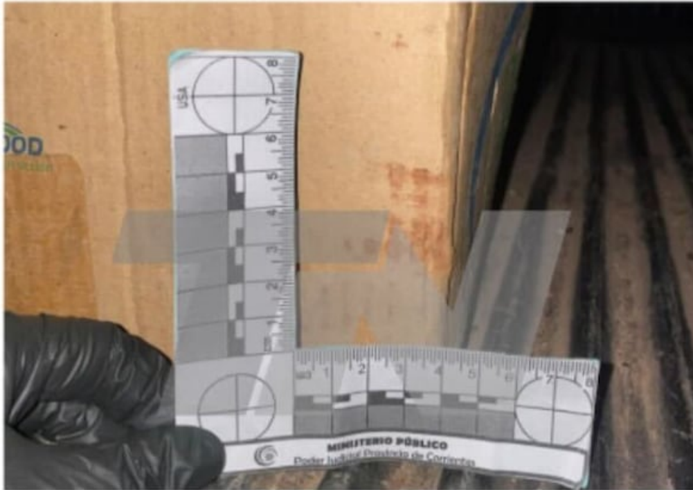
Fotografía N°6: Fotografía en plano medio de la mancha de coloración rojiza encontrada en la caja de cartón.-

camioneta de Pérez y Caillava.