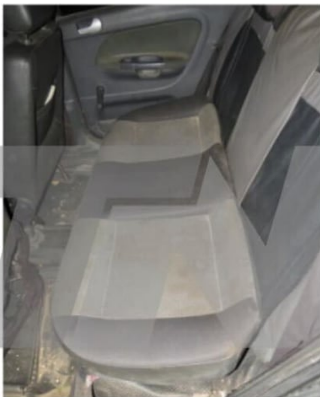
Fotografía General del asiento posterior del AUTOMOVIL VOLKS WAGEN VOYAGE dominio OKV605.-

El interior del auto Volkswagen Voyage de «Fierrito» Ramírez que fue peritado.