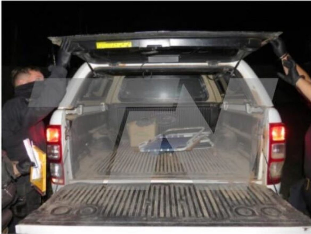
Fotografía general del baúl de la CAMIONETA FORD RANGER dominio AD595EH.-

La caja de la Ford Ranger también fue peritada.