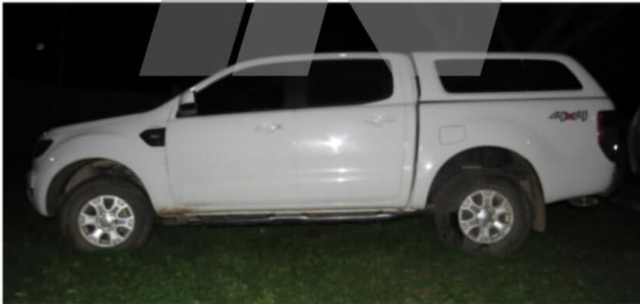
La camioneta Ford Ranger que fue peritada por el caso Loan.