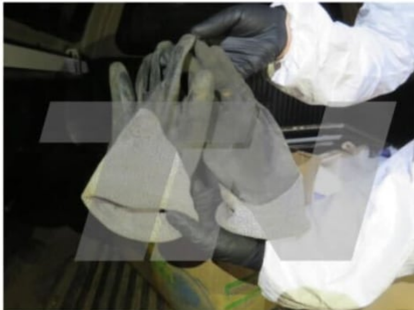
Fotografía N°7 Y 8: Fotografía en plano medio de los guantes color negro con gris, encontrados en la caja de cartón.-

La caja de la Ford Ranger también fue peritada.