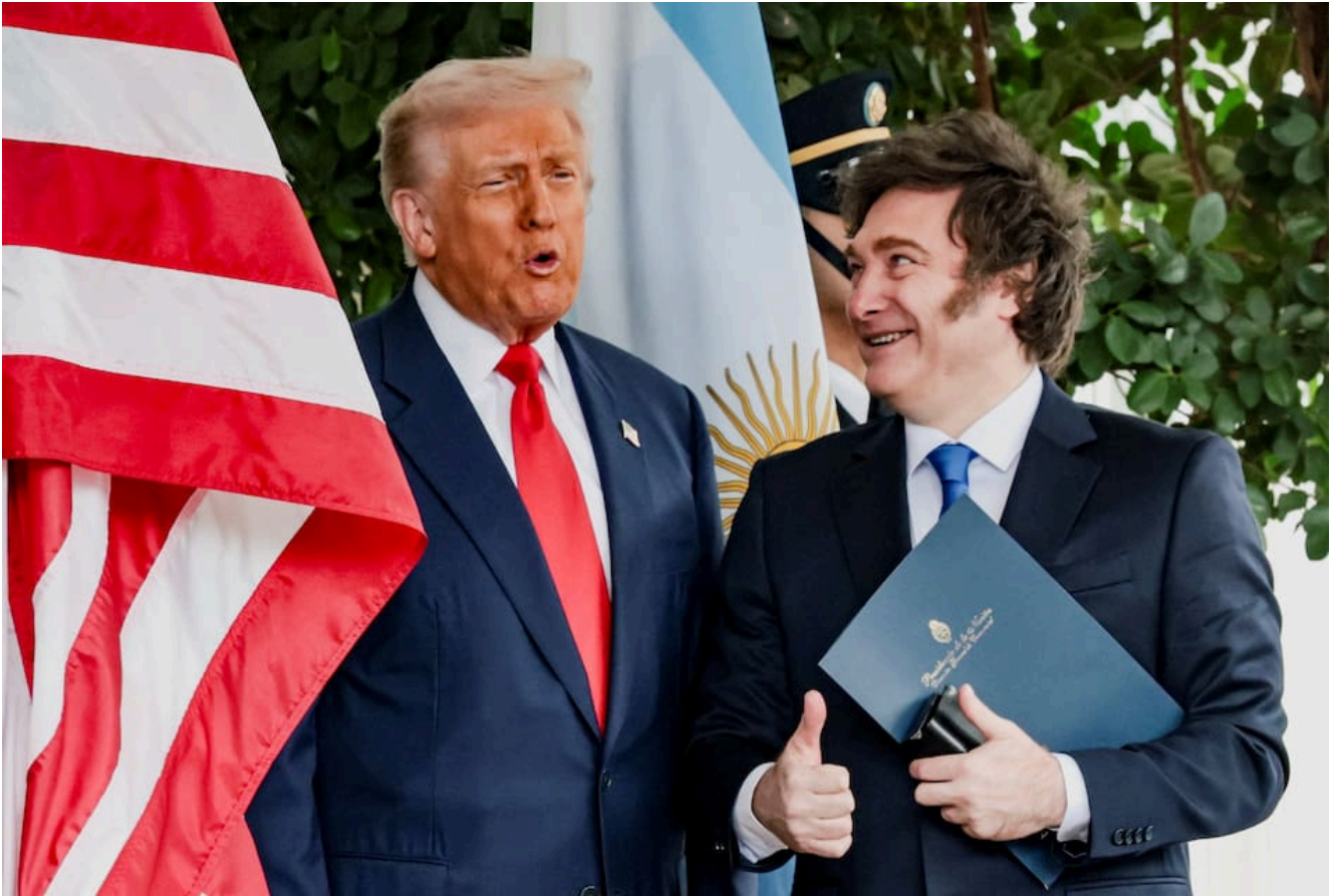
Javier Milei junto a Donald Trump.