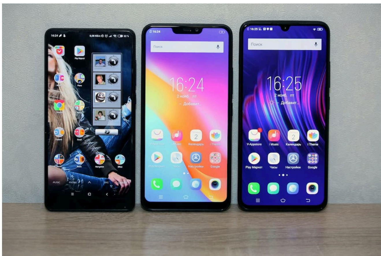
Celulares; smartphones; teléfonos.

Con este esquema, la compañía busca ofrecer una alternativa segura y transparente para quienes desean renovar su celular, otorgando un incentivo económico que puede variar según las características del dispositivo entregado.