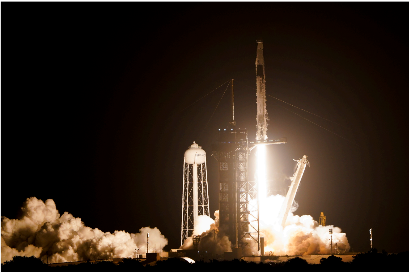
Imagen de referencia de un lanzamiento espacial

Aseguró el científico que no importa que la estación espacial esté viajando a 17,500 mph y en constante movimiento en órbita a 250 millas sobre la Tierra, ya que con la holoportación el astronauta puede ir a la Estación Espacial en algunos minutos, hablar y convivir con los demás miembros de la tripulación. O viceversa, traerá al astronauta a la Tierra para visitar a sus compañeros y familia.