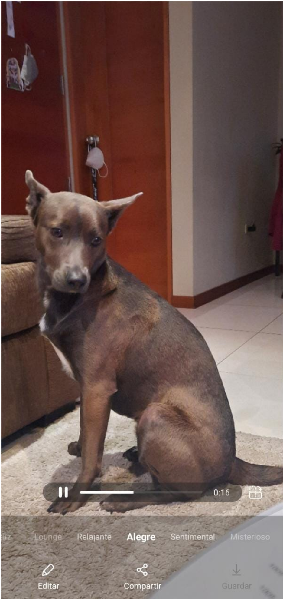
Video resumen con