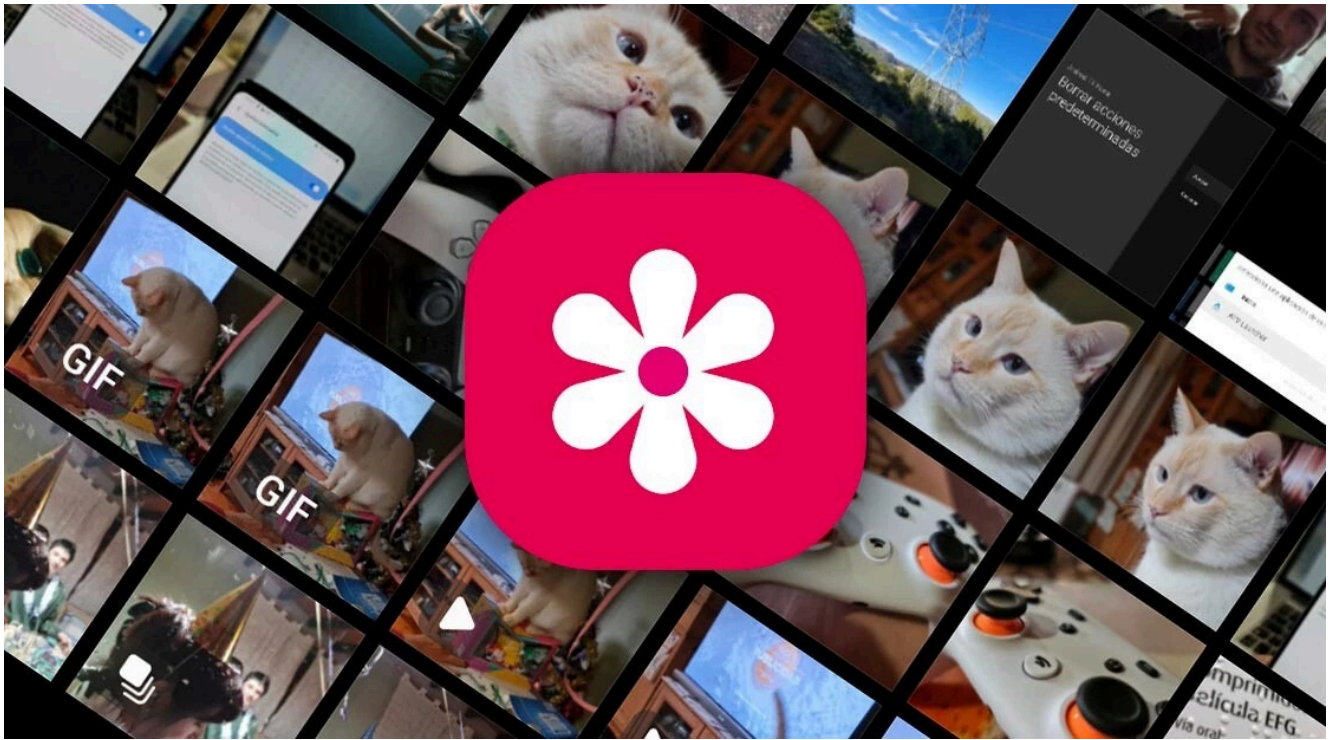
Aplicación Galería de Samsung.