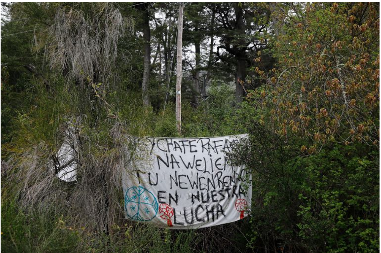
Villa Mascardi. Terrenos usurpados por la Comunidad Mapuche la RAM (Resistencia Ancestral Mapuche).

La comunidad Lafken Winkul Mapu usurpó en noviembre de 2017 tierras de Parques Nacionales en el kilómetro 2006 de la ruta 40, y luego fue extendiendo la toma a propiedades aledañas. Por las distintas usurpaciones y decenas de otros delitos denunciados en la zona existen múltiples causas abiertas, tanto en la provincia de Río Negro como a nivel federal.