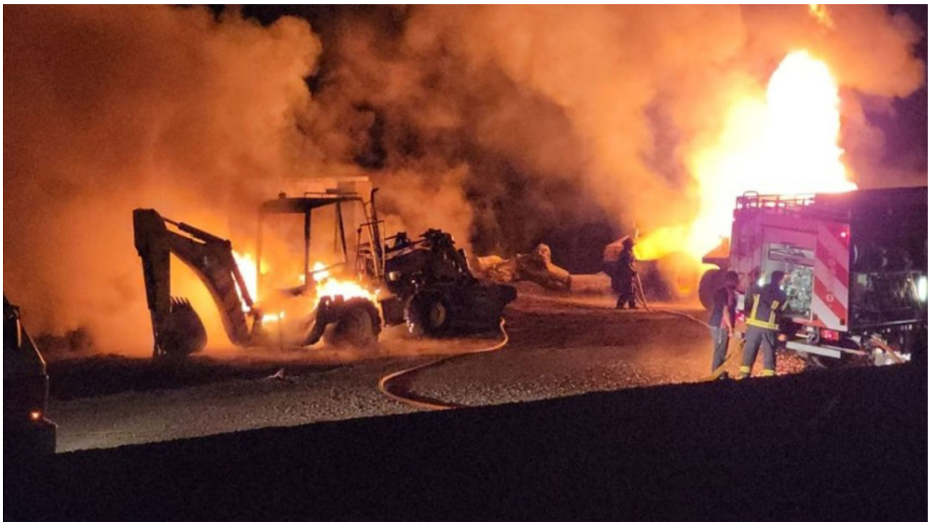
Imágenes del ataque en el sur que se adjudicó la Resistencia Mapuche

https://90c0f5fdaf4a03dc74e6320beb2b994f.safeimage.googleusercontent.com/safeimage/1-0-38/html/container.html