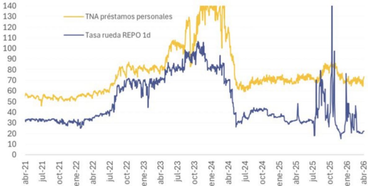
Tasa préstamos personales de bancos (TNA) versus tasa rueda REPO a 1d (serie diaria)