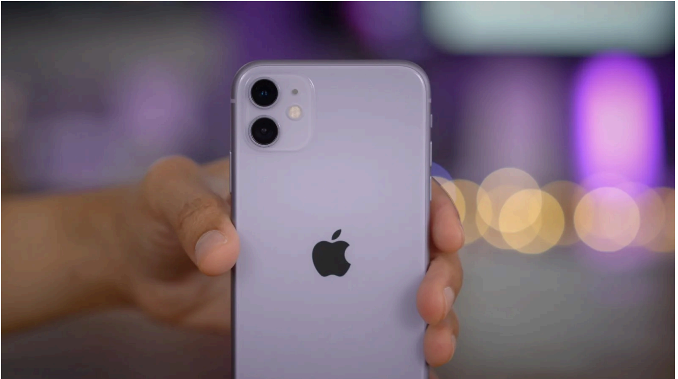
iPhone 11 morado.

como Negro Espacial , que solo llegaba al 23%, seguido por 11% de quienes preferían los colores blanco y plata.