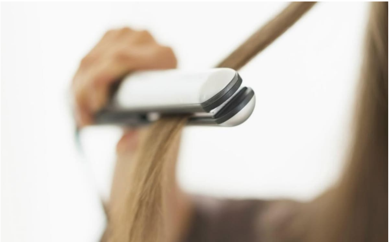
Planchita de pelo

Los expertos en peluquería y cuidado del cabello también recomiendan evitar pasar la planchita varias veces sobre el mismo mechón y regular la temperatura según el tipo de pelo, ya que una manipulación incorrecta podría derivar en un pelo encrespado, seco o incluso dañado.