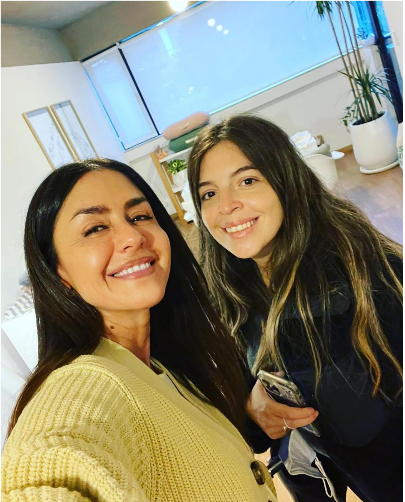
Dalma Maradona y su puericultora

En otra foto que subió, se mostró feliz de haber podido comenzar a darle el pecho a su segunda hija. En su texto recordó que su “primera lactancia no fue buena” y agregó: “De hecho no fue. No voy a dar detalles para no asustar a nadie