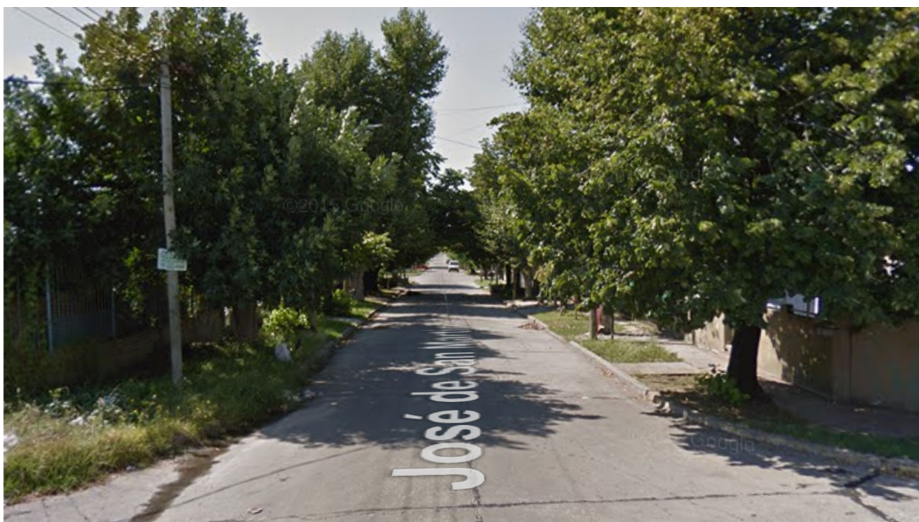
Lugar del hecho

Incluso, los detectives consiguieron algunas cámaras de seguridad del momento del hecho, pero no se llega a ver lo que ocurrió. Según indicaron las fuentes a Infobae , solo se ve a uno de los heridos escapar del lugar, que sería " Convulsión ", y a otro caer con la cadera dislocada, según informaron. Por las filmaciones, establecieron que los jóvenes debieron haber sido baleados en un trayecto de 700 metros entre que se los ve andar en la moto hasta que se los capta caídos y heridos.