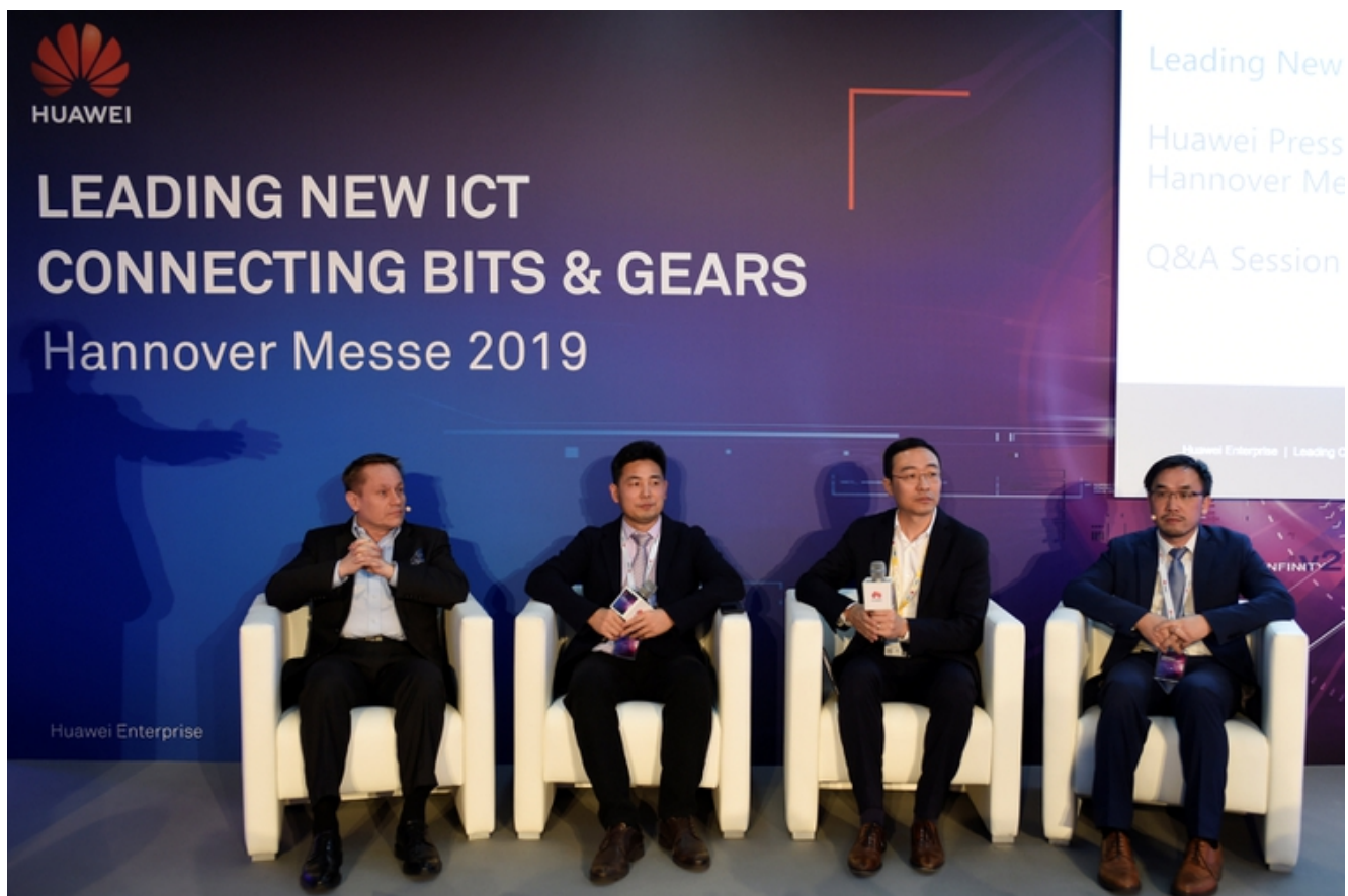
Conferencia de prensa de Huawei en Hanova, Alemania April 1, 2019.

Huawei “nunca ha hecho y nunca hará nada que comprometa o ponga en peligro la seguridad de las redes y los datos de sus clientes” , dijo la compañía. “Rechazamos enfáticamente estas últimas acusaciones. Una vez más, las acusaciones sin fundamento se repiten sin proporcionar ningún tipo de evidencia concreta», agregaron a través de un comunicado.