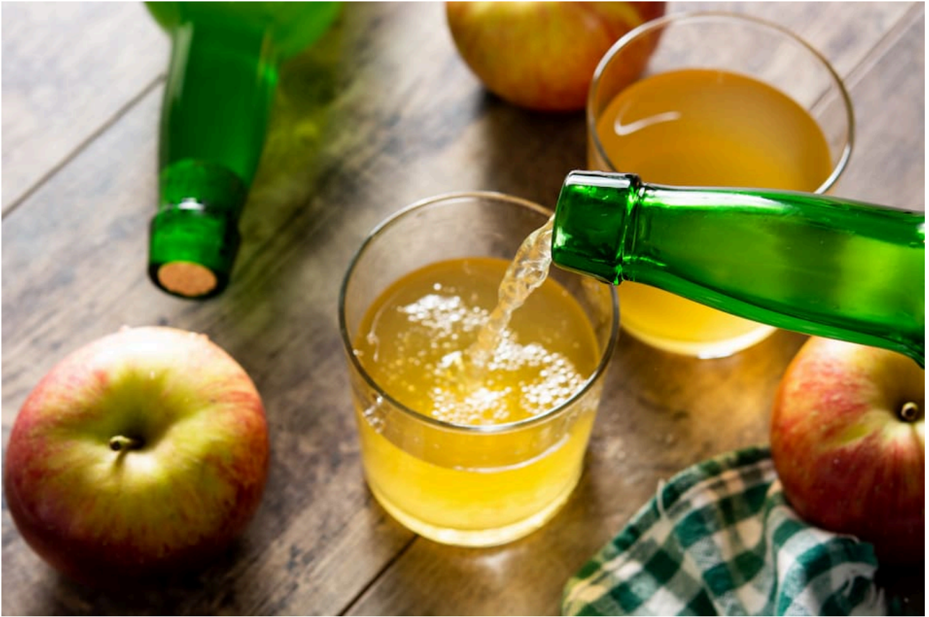
Sidra, ingrediente secreto