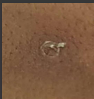
Costra parcialmente removida