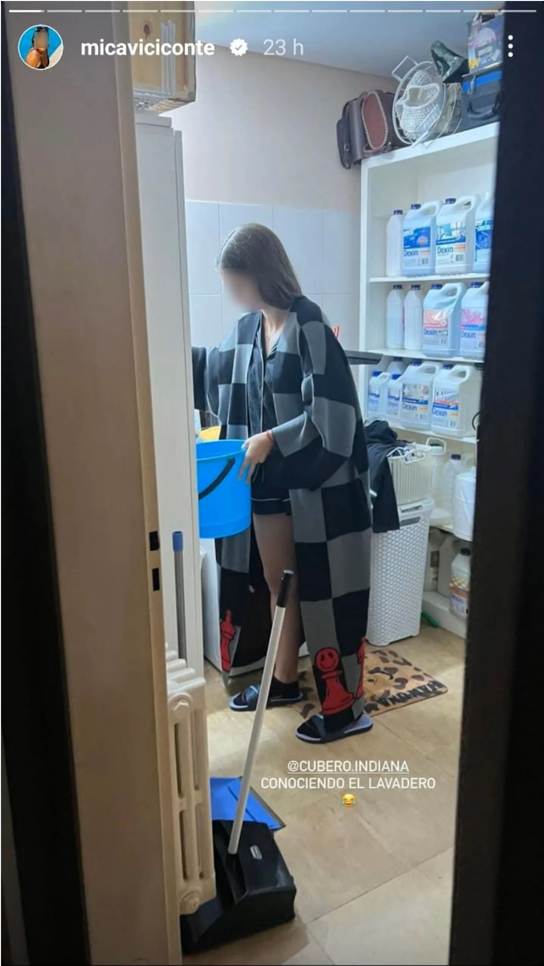
@CUBERO.INDIANA CONOCIENDO EL LAVADERO