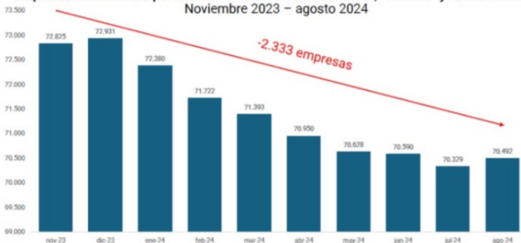
Empleadores cubiertos por ART en "Industria manufacturera", "Minería" y "Construcción" Noviembre 2023 – agosto 2024

► Con "Minería" y "Construcción", la pérdida de empresas alcanza las 2.333 de acuerdo con los datos de la Superintendencia de Riesgos del Trabajo (SRT).