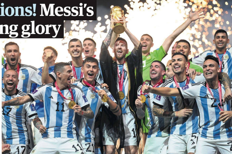
▲ Argentina's Lionel Messi lifts the Fifa World Cup trophy as his teammates celebrate their victory over France yesterday

This was, frankly, an emotional overload, a game that seemed to have been won