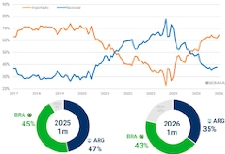
GRAFICO 1. Composición de los patentamientos por origen. (en % del total mensual)

Una posible explicación a la diferencia de patentamientos entre las marcas y el informe oficial podría proceder de un aumento de autos chinos que pasó bajo el radar. En enero ya había ocurrido con bajas de autos brasileños y argentinos