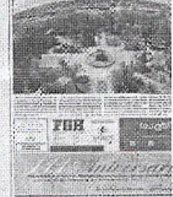
Gratis con su diario de hoy