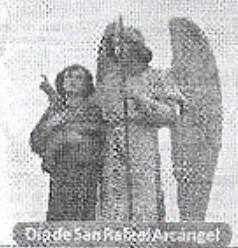
Día de San Rafael Arcángel