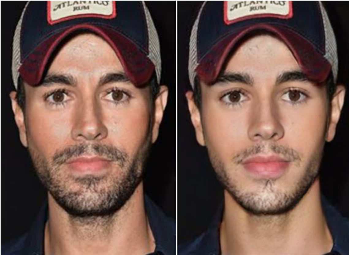
Cantante s famosos con un efecto para verse más juvenes.