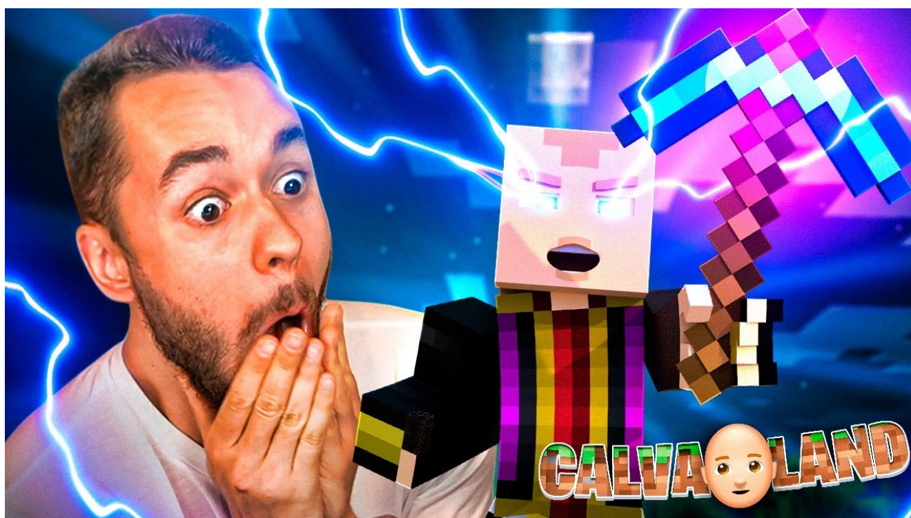
TheGrefg, YouTuber español.

La transmisión de video es otro ejemplo en el que el contenido producido en un país se puede exportar fácilmente. Al pagar a los creadores más de USD$ 6 mil millones en 2021-2022, YouTube está permitiendo que el contenido y la cultura trasciendan las fronteras.