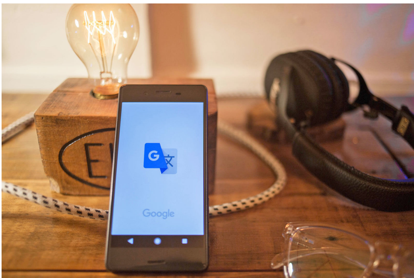
Traductor de Google.

Se pueden traducir sitios web completos, documentos escaneados o imágenes, lo que permite una comunicación transfronteriza fluida. Aunque la digitalización de los negocios no se considera en la evaluación general, aportaría eficiencia adicional a los balances comerciales.