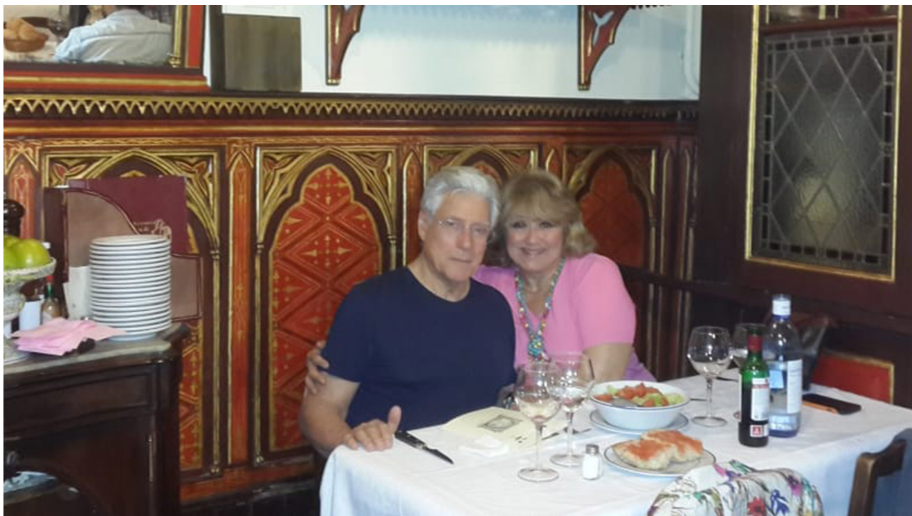
Festejando los 10 años juntos en Madrid