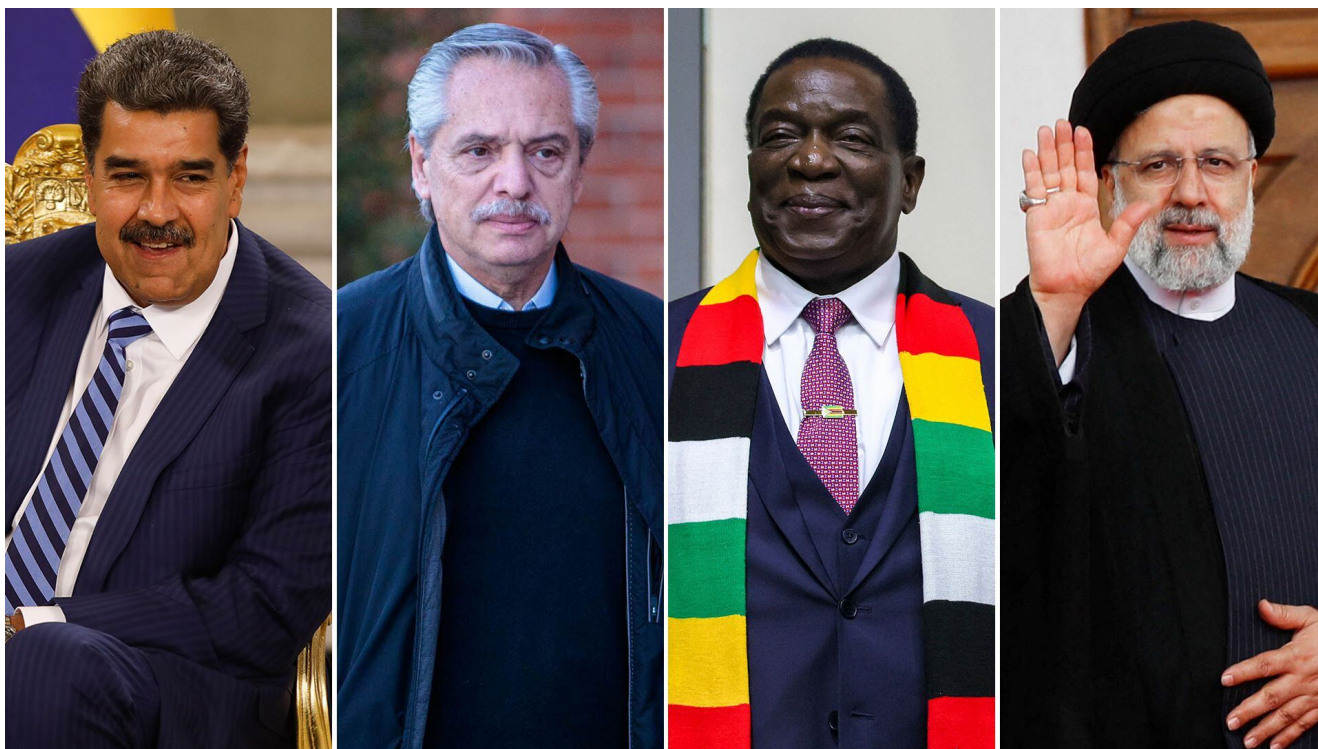
Nicolás Maduro, Alberto Fernández, Emmerson Mnangagwa y Ebrahim Raisi

Luego de la anomalía del 2020 por la pandemia, el nuevo índice reflejó que por primera vez en la historia del índice en 1996, "Hong Kong descendió de su primera posición. El gobierno chino impuso nuevas e importantes barreras a la entrada, límites al empleo de mano de obra extranjera y aumentos de los costes de hacer negocios, lo que impulsó un descenso en el componente de regulación de Hong Kong".