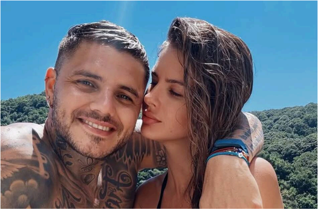
China Suárez y Mauro Icardi.

Iré al colegio allá. Hay cosas que se deberán cumplir, está todo organizado y en paz”, explicó a la prensa.