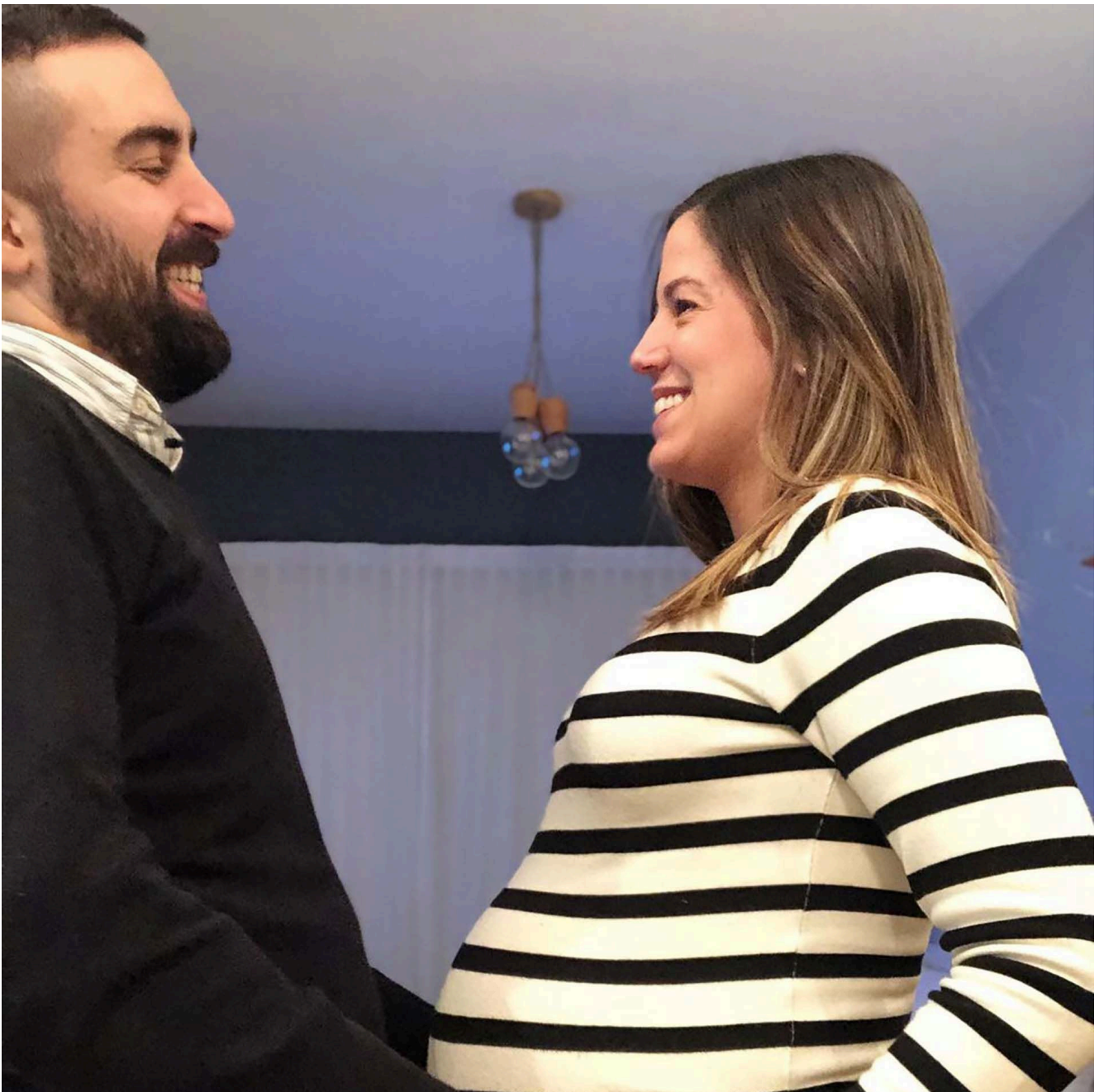
Cerca de la fecha de parto