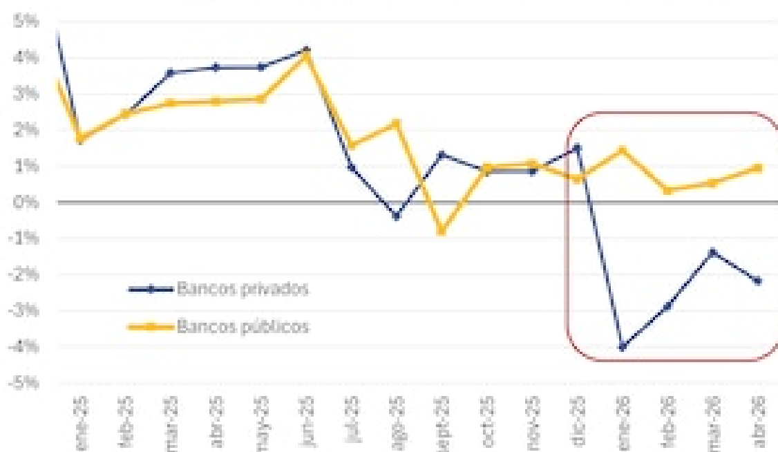
Variación mensual en términos reales de préstamos en Pesos a privados: por tipo de banco

El informe también examinó la situación de las entidades no financieras , que representan alrededor del 17% del total de préstamos a familias. En este segmento, la morosidad alcanzó en mayo el 32,2%, mientras que hace un año y medio era inferior al 10%. La suma de los saldos irregulares tanto de entidades financieras como no financieras refleja el deterioro de la capacidad de pago de las familias argentinas.