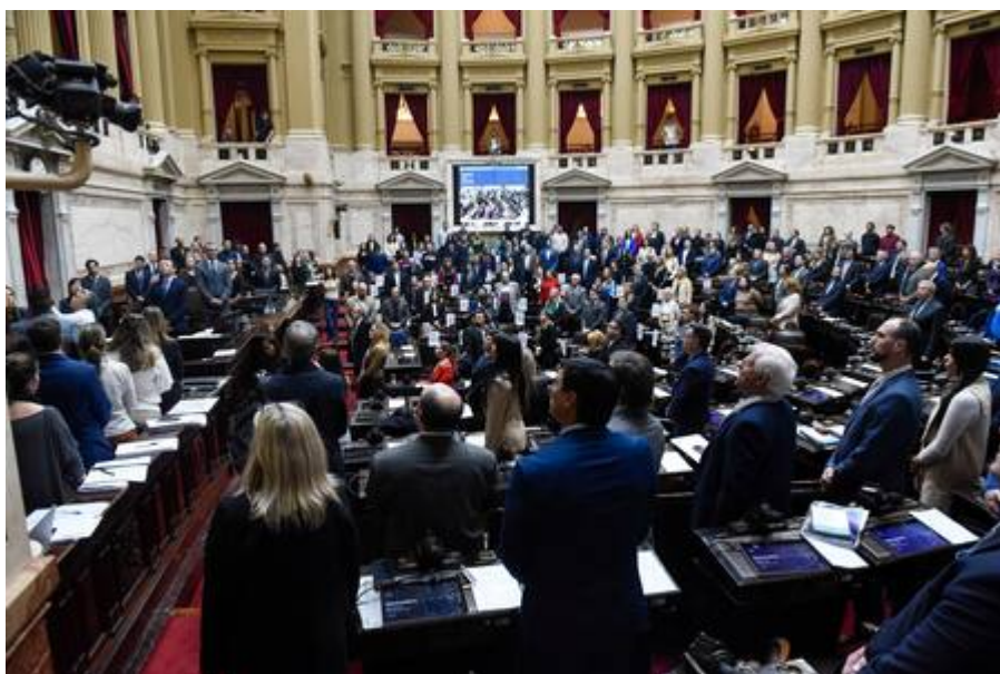
Sesión en la Cámara de Diputados.

A pesar de los cruces, el mecanismo quedó definido: se permitirá la participación de actores sociales, sectores productivos y comunidades indígenas registradas con tiempos acotados de exposición para garantizar la fluidez del debate. Además, se estableció un estándar de legitimidad: la reunión solo tendrá validez si cuenta con una asistencia mínima de cuatro diputados por cada comisión convocada.