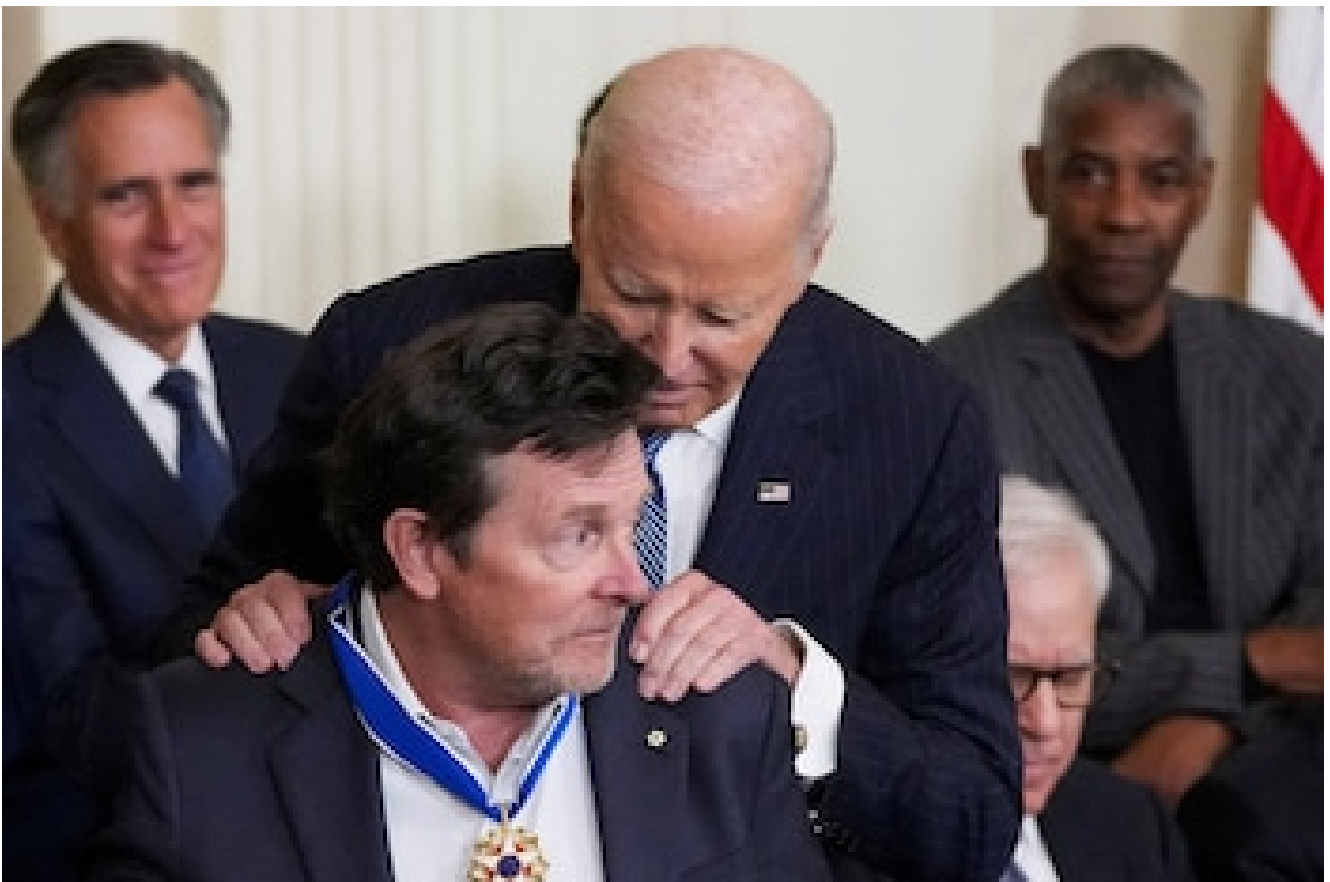
El actor Michael J. Fox durante el evento

Lionel Messi ha desempeñado una extensa trayectoria vistiendo las camisetas del Barcelona, París Saint-Germain e Inter Miami. Llegó a la Major League Soccer (MLS) a mitad de 2023 y, desde ese momento, registra 33 goles y 17 asistencias en 36 duelos con las Garzas , según consta en MessiStats , la página especializada en estadísticas del 10. Ganó dos títulos con esta camiseta (Leagues Cup 2023 y MLS Supporters' Shield).