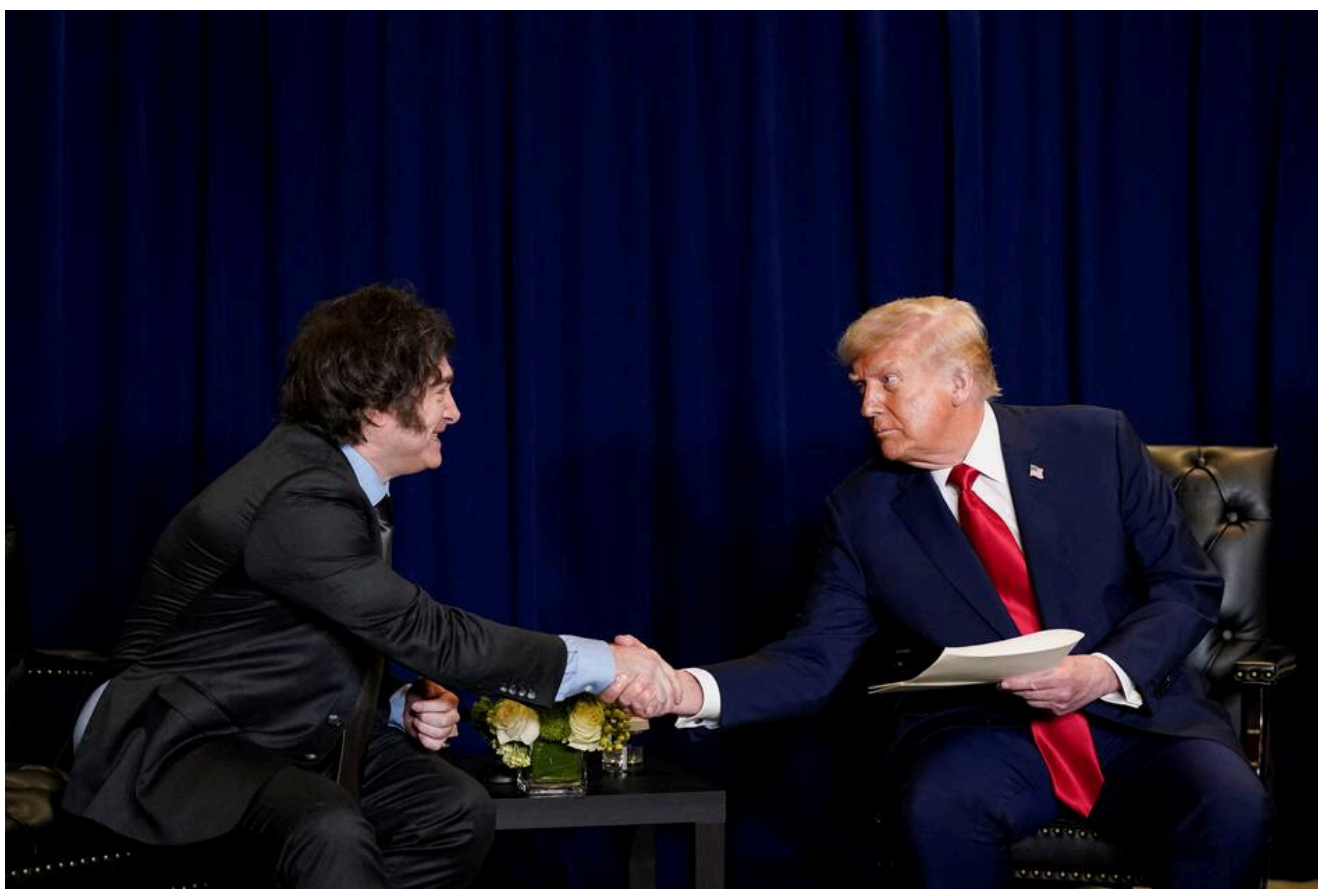
Reunión de Javier Milei con Donald Trump.

En este sentido, el embajador británico aseguró que el Reino Unido está dispuesto a avanzar en un acuerdo comercial con Argentina, en un contexto donde el gobierno de Milei ya selló un documento con Estados Unidos . “Por el momento lo estamos considerando. El ministro lo ha dicho públicamente: le gustaría que ocurriera. Pero necesitamos la autorización de todo el gobierno. Estamos evaluándolo. Queremos, sin dudas, aumentar el comercio y la inversión entre ambos países . Si un acuerdo entre el Reino Unido y el Mercosur ayuda a impulsar eso, él querría intentarlo”, señaló.