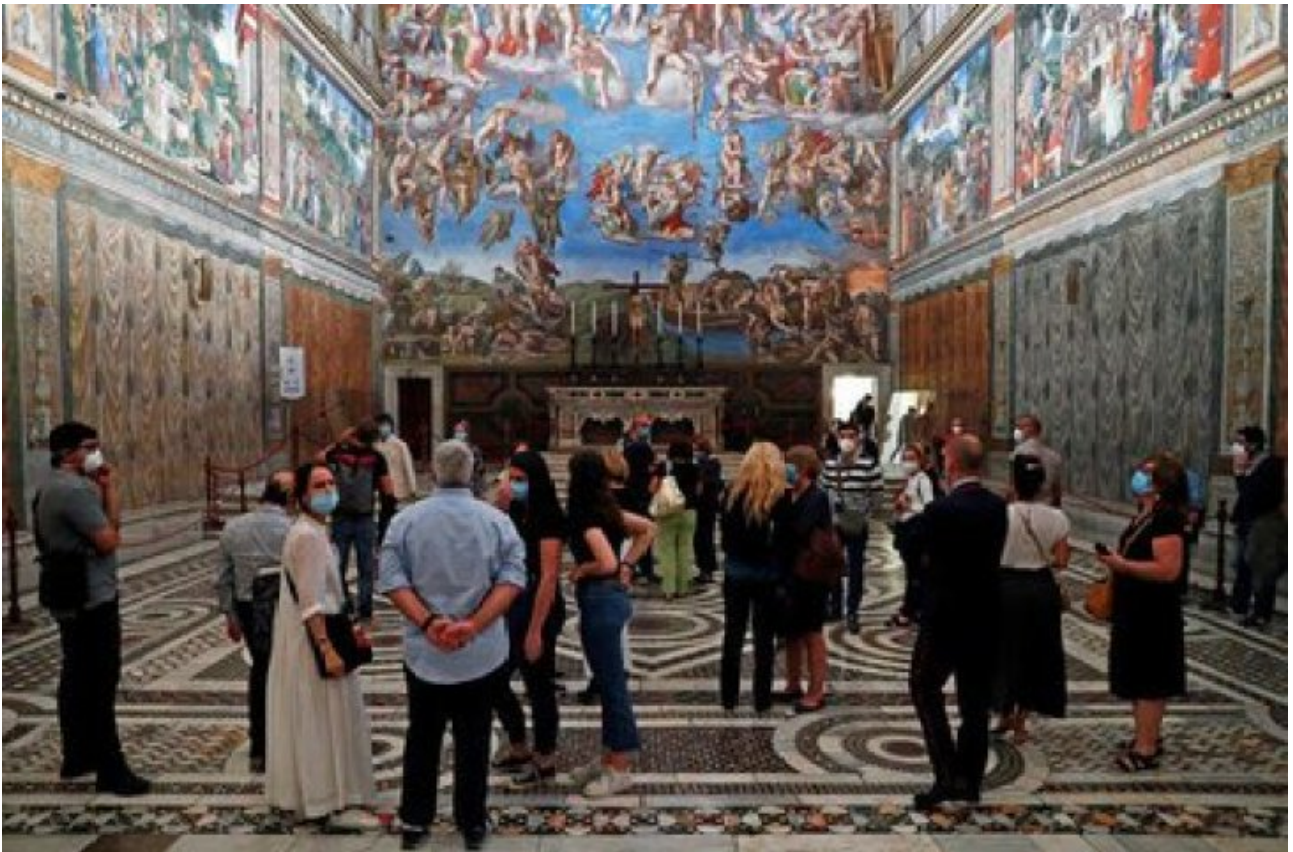
Foto de un grupo de personas en la Capilla Sixtina en medio de la pandemia de coronavirus. Jun 1, 2020.

Los Museos Vaticanos reúnen la mayor colección de arte de la Iglesia Católica Romana y son una de las principales atracciones turísticas de Roma. En ellos se encuentra la célebre Capilla Sixtina .