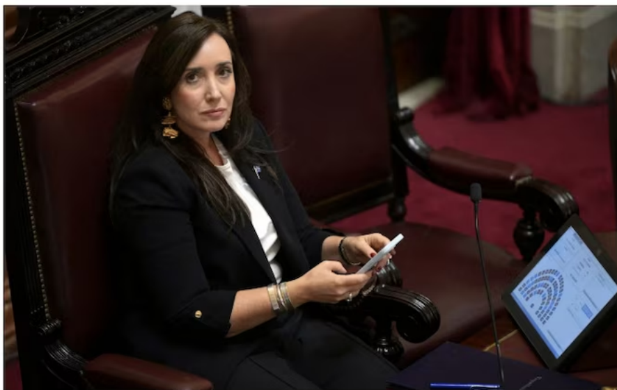
Victoria Villarruel wrote on social media: 'Today, more than ever, the Malvinas are Argentine'

James Crisp Europe Editor. Gerard Couzens