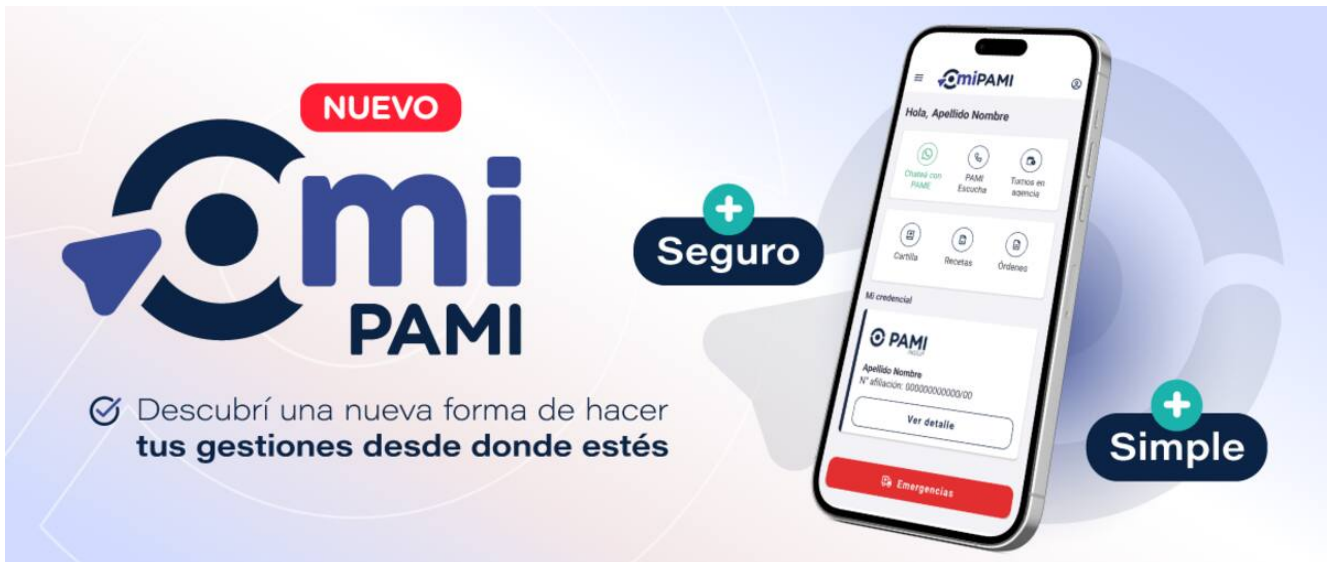
Aplicación «Mi PAMI».