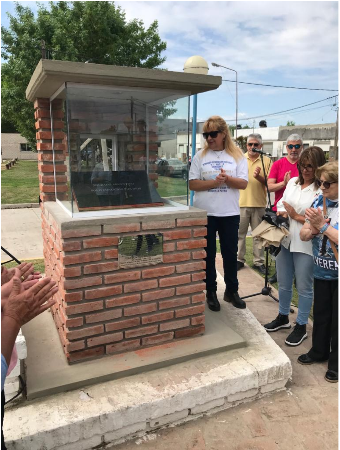
Se construyó un pedestal donde se colocó la placa, que la Comisión de Familiares de Caídos entregó en préstamo al municipio.