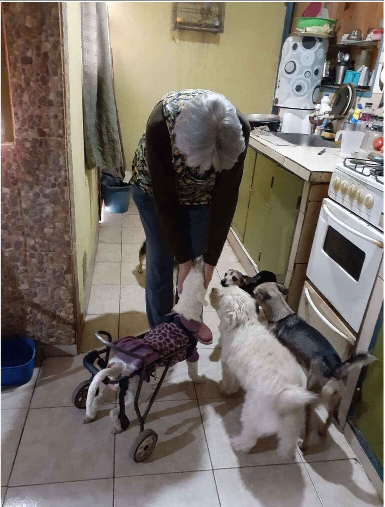
La mujer tiene a su cargo 14 animales que alimenta y cuida día a día.