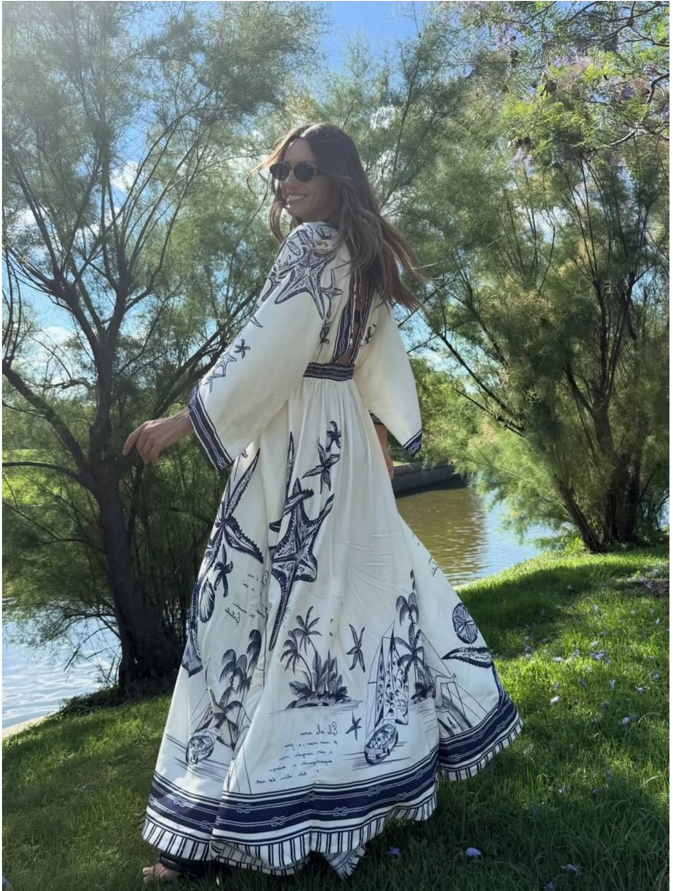
Pampita luciendo una túnica de estilo maxi.