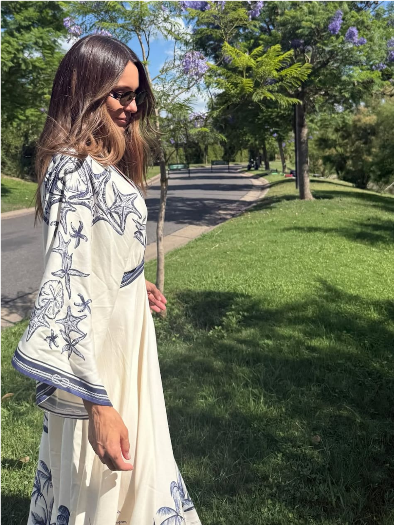
Pampita luciendo una túnica de estilo maxi.