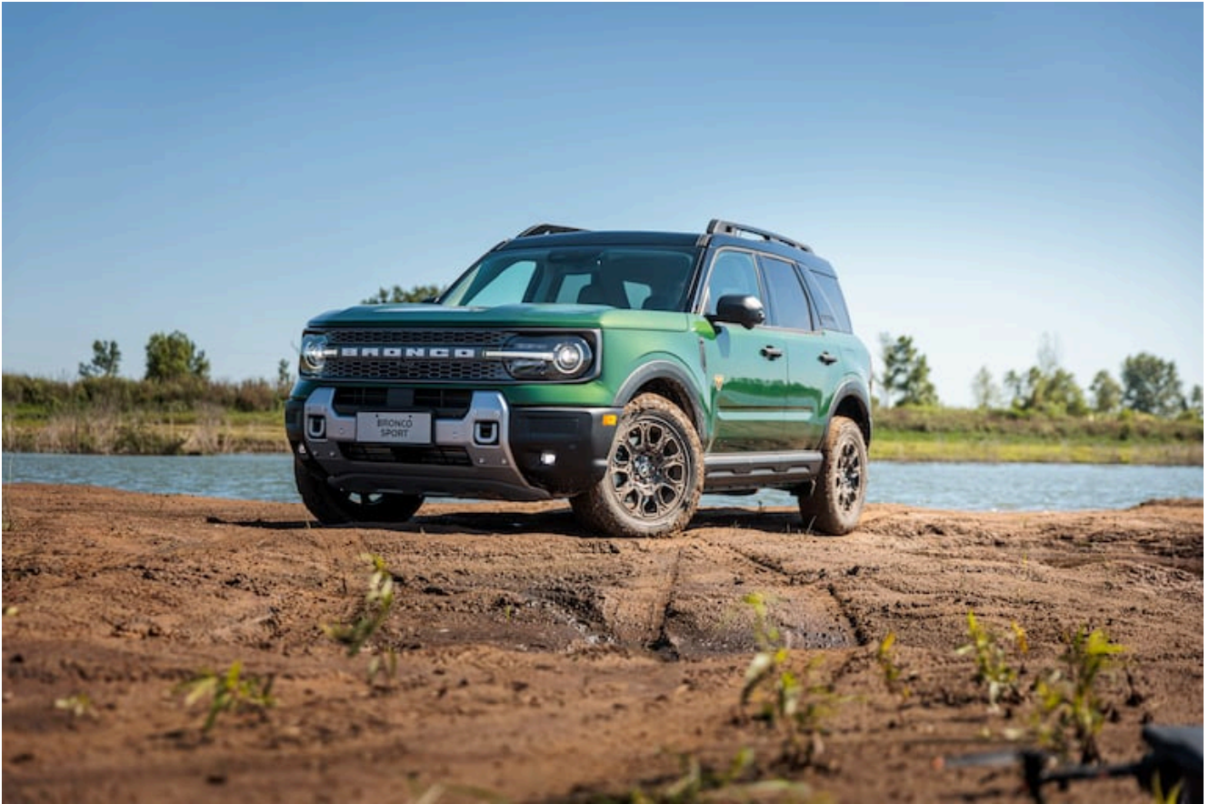
Bronco Sport 2025.