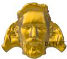
Figura De Lionel Messi Que Miras Bobo En 3d - Detta3d