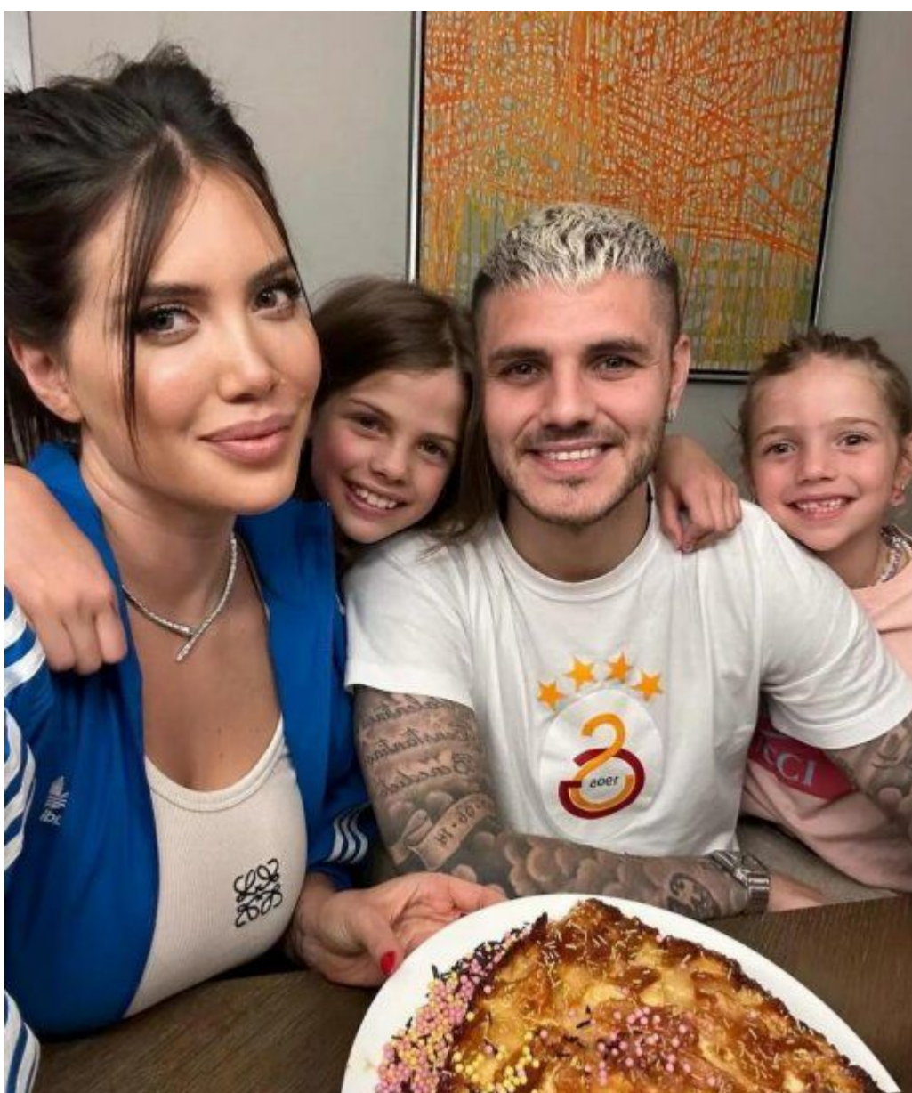
Mauro Icardi con Wanda Nara y sus hijas en Turquía

El informe estableció que la terapia «les permitirá flexibilizar posicionamientos y trabajar sobre las conductas disfuncionales de su personalidad para que puedan ejercer una parentalidad saludable». En el caso de la conductora, se le recomendó trabajar sobre el control que ejerce sobre las niñas, mientras que a Icardi se le indicó abordar sus conductas disruptivas para poder desarrollar un vínculo más positivo con sus hijas.