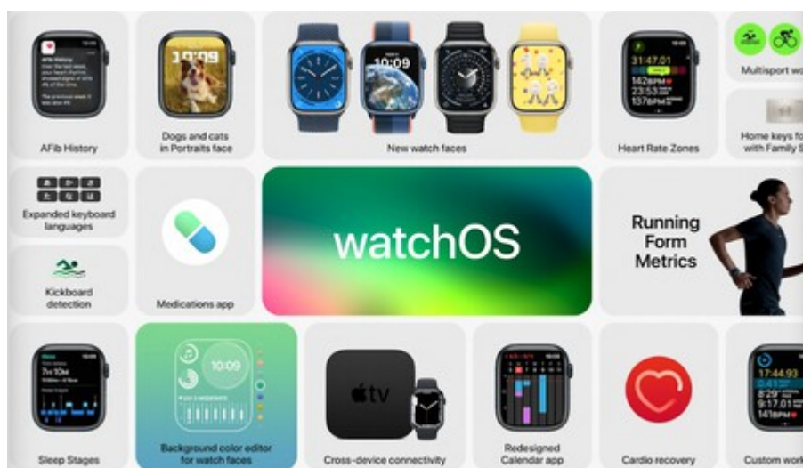
watchOS 9.

Asimismo, hay novedades en la app Sueño , ya que se podrá ver las diferentes fases por las que se pasa cada vez que uno va a la cama. Toda esta información también se tendrá disponible en la app Salud del iPhone.