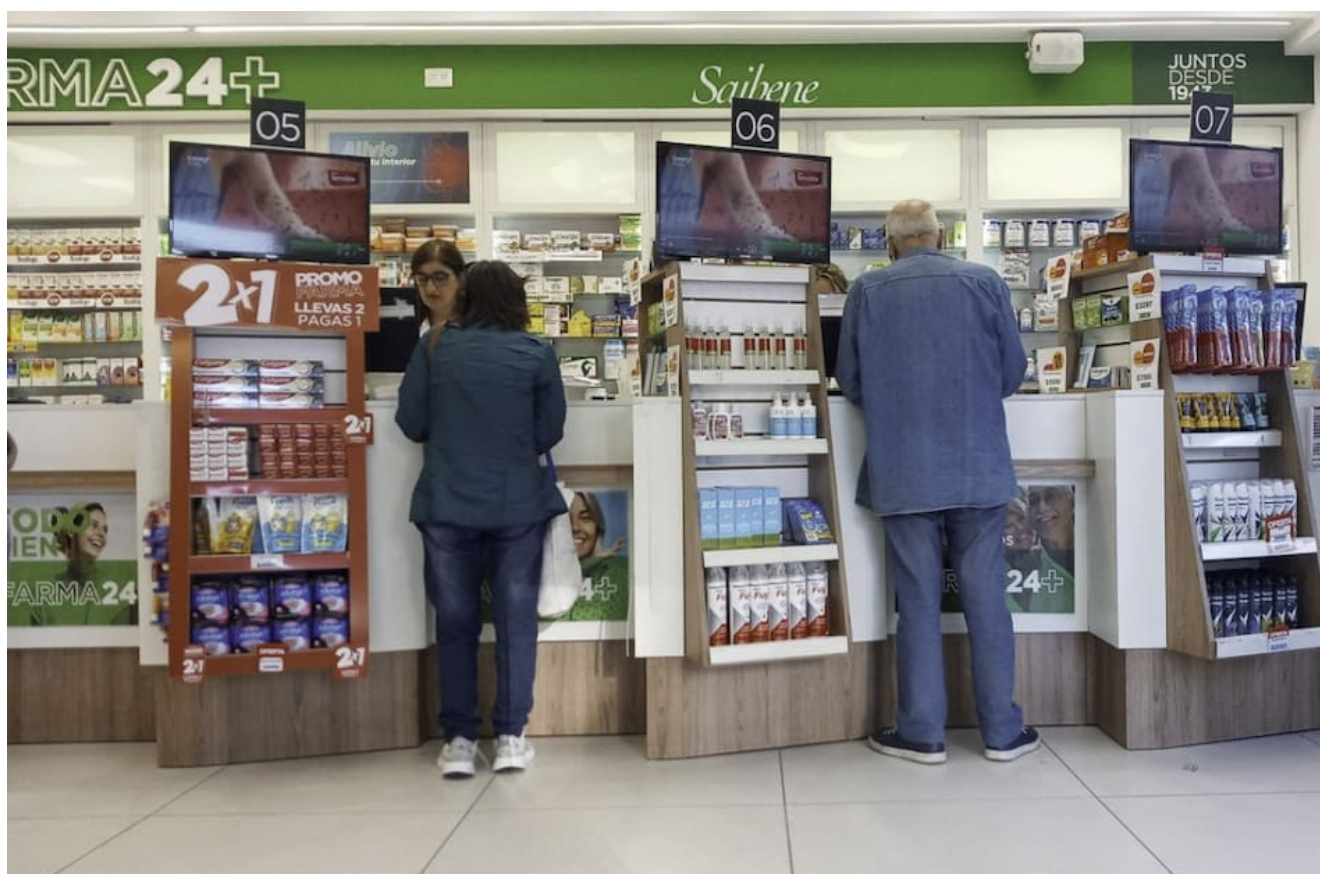
Jubilados y la compra de medicamentos por PAMI.

El programa está dirigido a aquellas personas que, por su situación socioeconómica, no pueden afrontar el gasto de sus medicamentos.