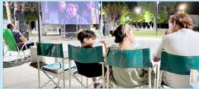
San Rafael tendrá varias actividades culturales y recreativas durante el fin de semana largo por los feriados de Carnaval, y una de ellas será el ciclo "Cine bajo las estrellas". (Pág. 5)

Cine en pantalla gigante, patios de comida y artesanos en el Parque de los Jóvenes